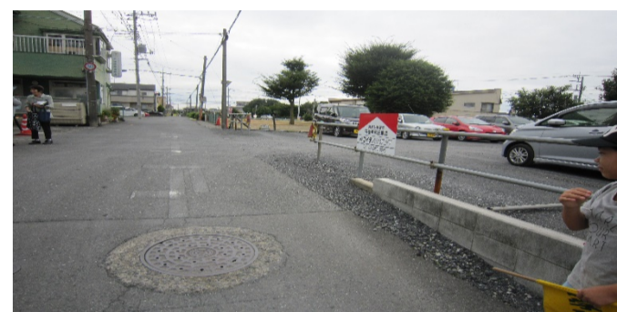
子どもの下校時、さやま整形外科駐車場付近の出入りが激しい