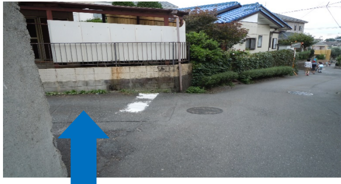
からくる車が見えにくい