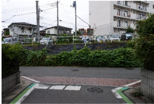
車の通行が見えにくい