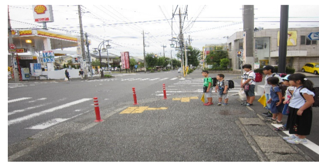
信号待ちの際、自転車や歩行者の通行が多いため道をふさがないように注意