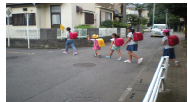
横断歩道がないため注意してわたる