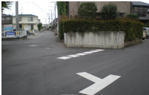
標識はないが一時停止が必要