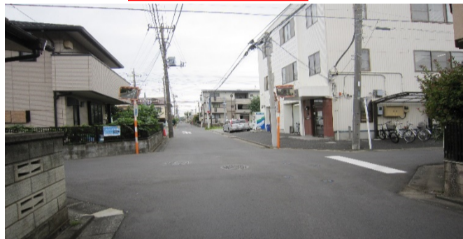
車がスピードをあげて通行する