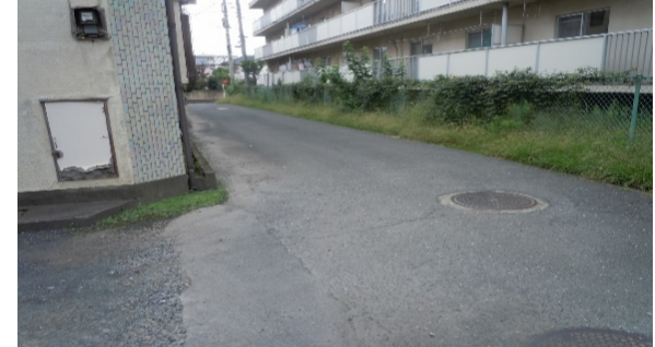
狭い道で車がスピードを出して通ることが多い