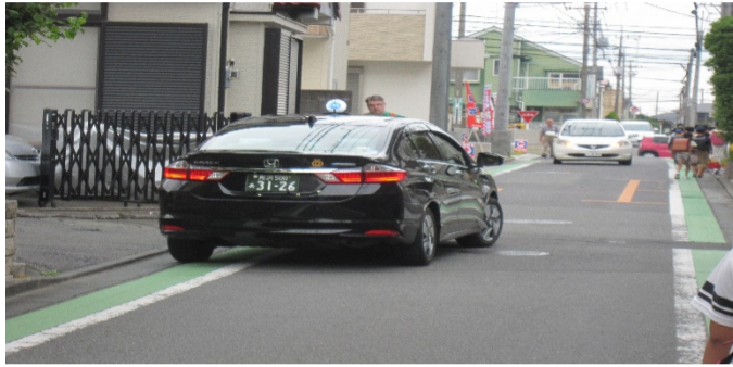
歩道だけでなく、駐車場に入る車にも注意