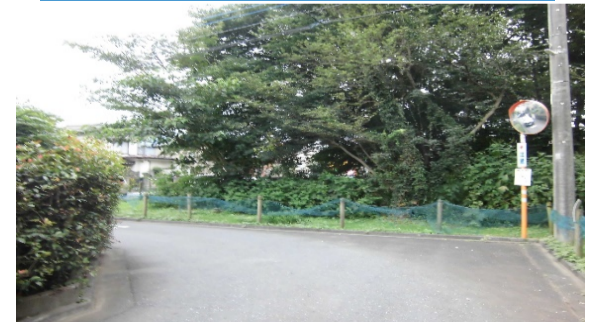
車が見えにくく、車の通行量が多い