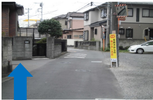
からくる車が見えにくく、通行の道幅が狭い