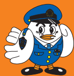
埼玉県警察マスコット「ポッポくん」