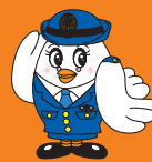
埼玉県警察マスコット「ポポ美ちゃん」