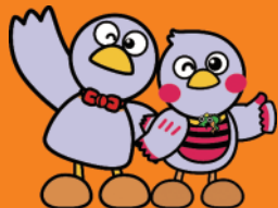
埼玉県マスコット「コバトン」「さいたまっち」