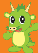
さいたま市PRキャラクターつなが電ヌウ