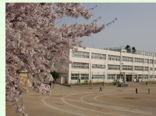
狭山市立入間川東小学校