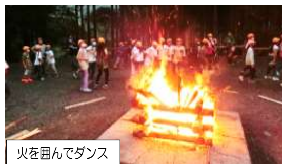
火を囲んでダンス