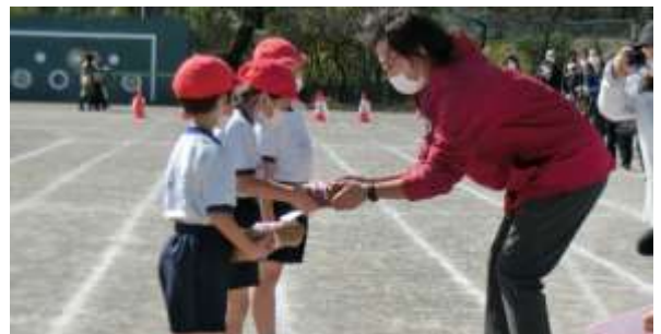
PTAから記念品をいただきました。ありがとうございました。