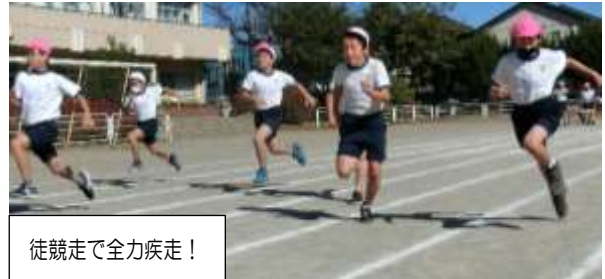
徒競走で全力疾走!

11月1日～10日にかけて、運動会の代替行事「いるまのスポーツフェスタ」が開催されました。子供たちは自分の持てる力を十分に発揮し、一生懸命競技に取り組んでいました。当日は、保護者の皆様にも、たくさん応援をいただきました。ありがとうございました。