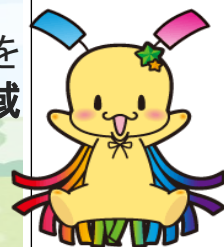
狭山市七夕の妖精 おりひい