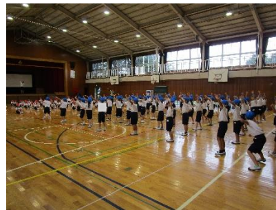
一・二年生の練習風景