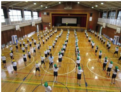
三・四年生の練習風景

10・11月は、学校行事が目白押しです。当日に向けて、練習が始まりました。10月当初の講話朝会でも子供たちには話をしましたが、表現運動（ダンス等）では、体の動かし方を教え合ったり、移動の際は、声をかけ合ったりすること、団体競技（玉入れ、台風の目、綱引き、リレー等）では、みんなで作戦を立てたり、誰かが失敗しても、許してあげたり、励ましたり「よい声かけをすること」が大切で、当日は、緊張感を味わいながら、一生懸命競技をしてほしいと思っています。