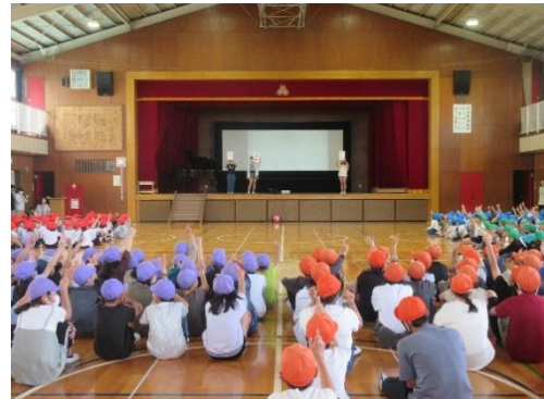
音楽委員会によるクイズ