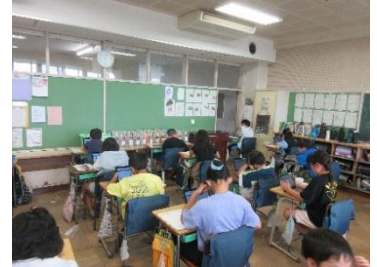
CBT埼玉県学力学習状況調査

今年度からタブレット端末等を活用した調査(CBT=Computer Based Testing: タブレット端末等を使用した調査)を県内全域で実施しました。この方法で調査を行うことにより、これまで紙で実施してきた調査(PBT=Paper Based Testing: 紙による調査)以上学びの状況を詳細に把握し、指導方法の工夫・改善や子供たちの学力向上につなげていきます。4年生から6年生を対象に行われたこの調査は、子供たちが現在の実力を知り、「 どれだけ自分が伸びたか 」を実感し、 自信を深めていくことをねらい としています。この結果は、2学期の個人面談の際に返却する予定です。