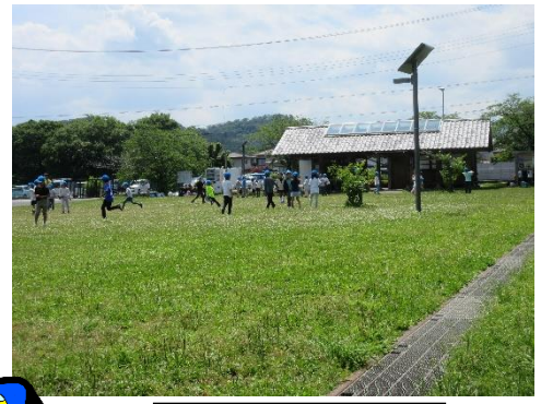
芝生の上でおにごっこ