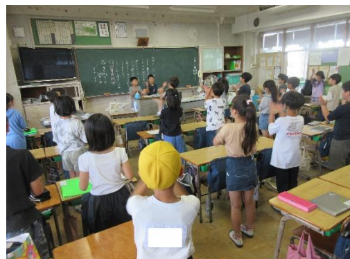
下級生に指導し、盛り上げる5年生